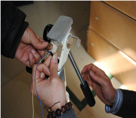
第七步：拆掉手柄并取出损坏配件。